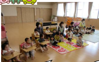
ホールに集まります